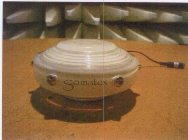
Obrázek 2.A – EUT v průběhu měření emisí

Zařízení bylo provozováno v zapnutém stavu režim svitu.